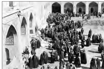
■ حضور فعال مردم در جنبش تنباکو به تبعیت از علما ■ نمایندگان دوره‌های نخست مجلس شورای ملی

برخورد رقابت‌آمیز عالمان دینی با قاجار، حرکتی اصلاحی بود. آنها برای اصلاح برخی رفتارهای پادشاهان قاجار تلاش می‌کردند. جنبش تنباکو نمونه‌ای موفق از فعالیت رقابت‌آمیز اصلاحی یک نمونه موفق، از فعالیت رقابت‌آمیز اصلاحی را نام ببرید