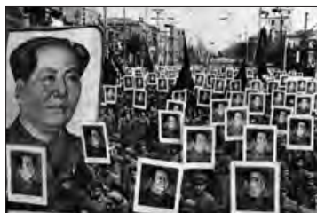
■ انقلاب‌های کوبا، الجزایر، هند و چین