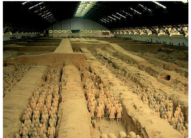
آرامگاه شی هوانگ تی

نمونه سوالات مکمل درس برای درک بهتر مطالب مطرح شده در درس