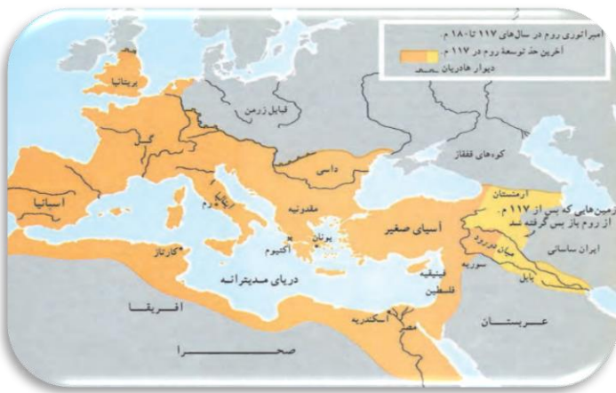
نقشه قلمرو امپراتوری روم

اقدام امپراتور کنستانتین در انتخاب بیزانتیوم (قسطنطنیه) به پایتختی، موجب تقسیم روم به دو بخش غربی و شرقی شد