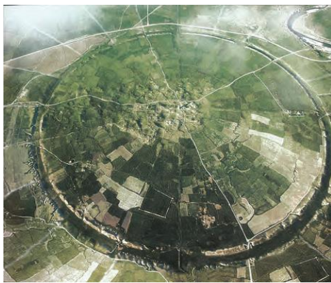
عکس هوایی از بقایای شهر فیروزآباد (گور)

نکته: طرح و نقشه شهرهای ساسانی مثل شهرهای اشکانی به شکل دایره بود.