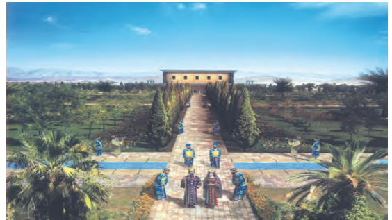
طرحی از کاخ کورش پاسارگاد

هنر در عصر هخامنشیان در چهار زمینه ادامه یافت: