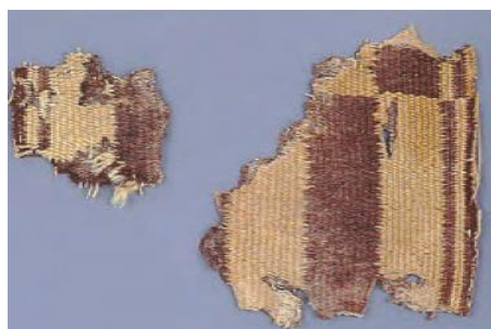
قطعه هایی از بقایای پارچه های پشمی به جا مانده از ساسانیان-موزه متروپولیتن نیویورک

نکته: قالی بهارستان که اعراب مسلمان از کاخ تیسفون به غنیمت گرفتند، شهرت بسیار دارد.