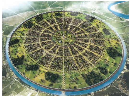
نمونه بازسازی شده تصویر سمت چپ