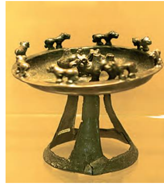
ظروف فلزی و سفالی دوره اشکانیان