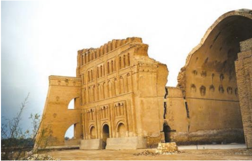
بقایای طاق کسری ( کاخ تیسفون)

حکومت ساسانی نیز همچون حکومت های پیشین و بلکه بیشتر از آنان به هنر و هنرمندان اهمیت می داد. در اثر توجه حکومت ساسانی به هنر و حمایت از آن، هنری پدید آمد که به لحاظ عظمت و شکوه، با هنر روم برابری می کرد و گاه بر آن برتری داشت. هنر ساسانی ریشه در هنرهای کهن ایرانی، هنر هخامنشی و هنر اشکانی داشت. هنر ساسانی حتی از هنر یونانی و رومی نیز تأثیر پذیرفته بود. پس از سقوط ساسانیان و ورود اسلام به ایران، هنر اسلامی تأثیر بسزایی از هنر ساسانی پذیرفت.