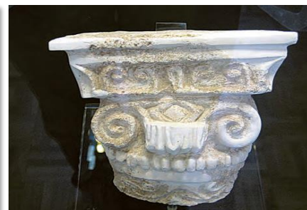
تزیینات معماری دوره اشکانی اشکانی