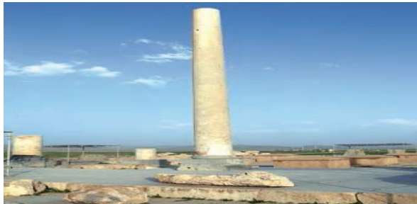
بقایای کاخ کورش پاسارگاد