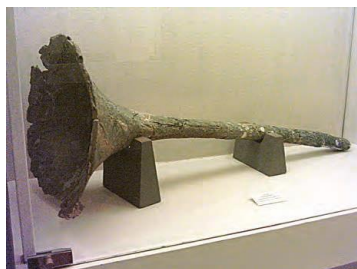
کَرنا، یکی از سازهای موسیقی به جا مانده از دوره باستان

دوره ساسانی یکی از دوران های درخشان موسیقی ایران است. هنرمندان در دوره ساسانی، بیش از پیش مورد توجه شاهان قرار گرفتند و از منزلت و امتیازات ویژه برخوردار شدند. از خوانندگان و نوازندگان آن دوره با عنوان گوسان، خنیاگر و رامشگر یاد شده است.