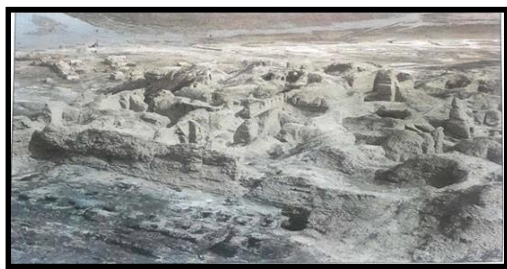
بقایای بناهای کوه خواجه و نقاشی دیواری آن - سیستان - دوره

هنر گچ بری در بناهای کوه خواجه به نهایت ظرافت خود رسید.