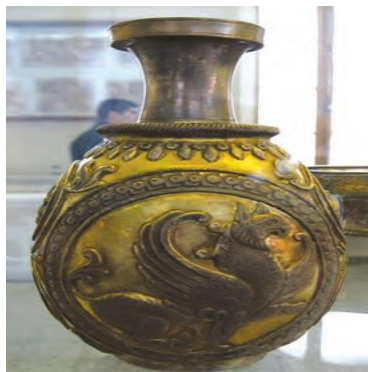
ظروف فلزی دوره