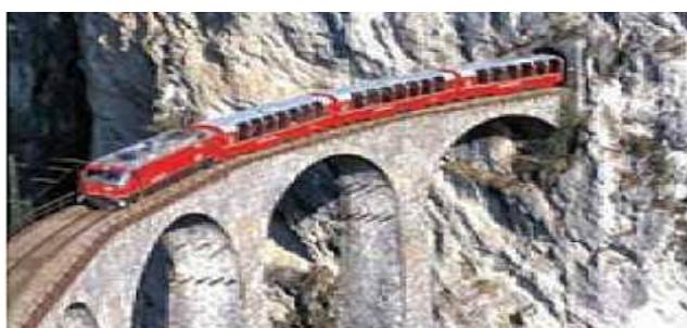
احداث تونل و پل برای عبور قطار در تاحیدای کوهستانی و برفگیر - سوئیس

برای مثال راه آهن در کشوری که نواحی کوهستانی و مرتفع دارد دشوارتر و پرهزینه تر از کشوری که بیشتر زمین های آن پست و جلگه ای هستند.