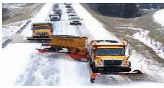
پد کارگیری ماشین برفروپ مجهز بد چینی برای اس جادهای برای یاک سازی جادهها - کانادا