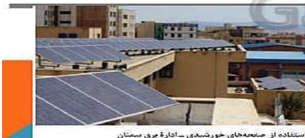
استفاده از پنل‌های خورشیدی - اداره برق مسقط