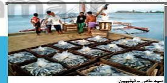
صید ماهی - فیلیپین